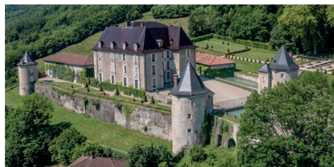
Jardins et Château du Touvet